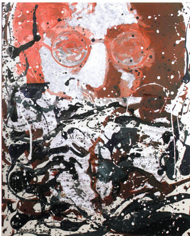
Fluorescent , olio e tecnica mista, 80 x 100 cm

Una pittura che ha sicuramente radici nelle altre passioni di questo pittore: la musica, il fumetto, la poesia, le quali infondono maggiore spessore all'espressione artistica del loro autore. Lo dimostrano gli inserimenti d'immagini mitizzate (spesso soltanto con particolari) di personaggi noti, di strumenti pianistici in forme grafiche o di figure che sembrano sfuggite da strisce disegnate e, infine, di colori lirici che arrivano al cuore. In questo ambito dell'espressione creativa, l'amalgama delle esperienze e dei linguaggi diversi di Franco Barrese si compenetra in un'unica tensione comunicativa, in cui l'importanza dei segni è sottolineata da contorni marcati. Le sue opere entrano nell'anima dei fruitori come sguardi di ottimismo e appaiono elaborate, materiche, caratterizzate da una plasticità incisiva, forse più marcata nella serialità di alcune rappresentazioni.