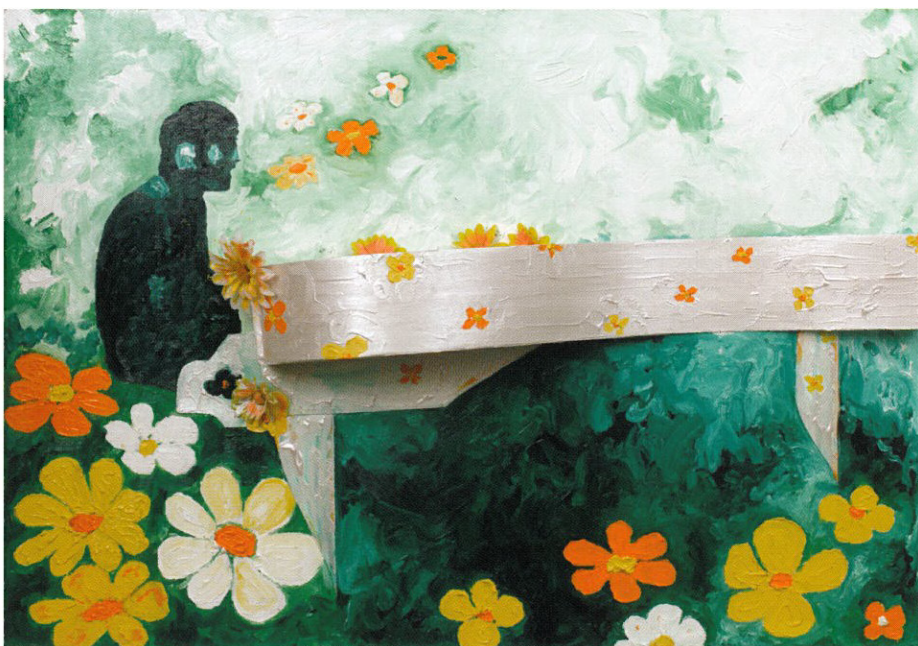
Piano and yellow flowers , olio e tecnica mista, 100 x 70 cm