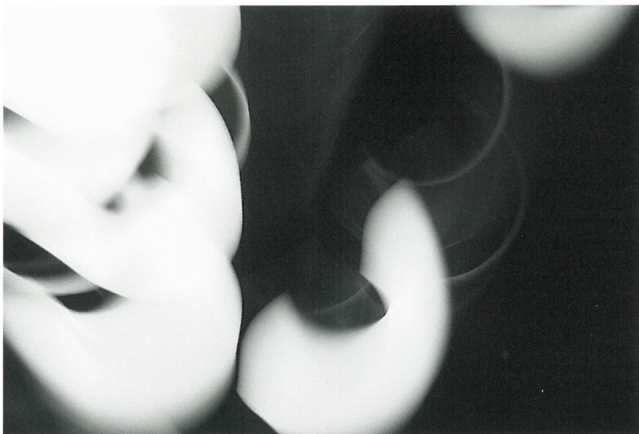
Antitesi, oasi oniriche, 2007, digital c print lightjet diasec® Grieger su dibond 4mm, 164,4 x 110 cm

Il peso delle ombre e dei bianchi mostra, in sintesi, il modo efficace di vedere e vivere la fotografia di questo autore. Così gli scatti, attraverso una semplificazione dei grigi, tendono a offrirci un mondo in bianco e nero, dove i due estremi contengono il tutto e le immagini, tecnicamente ricercate, rimandano a memorie attinte da "oasi oniriche". È da lì che trovano una loro dimensione spaziale e acquistano un'espressività lirica senz'altro contemporanea. Silvio Balestra, forse, mitizza l'aspetto della luce, quasi strappando le sue istantanee da un profondo itinerario inconscio, lontano da rigidità progettuali e senza ricercare invenzioni-novità a tutti i costi, in una risonanza di vibrazioni interiori. Si possono definire folgorazioni o apparizioni analogiche digitali, proiettate in una visione ove scompare ogni forma del reale.